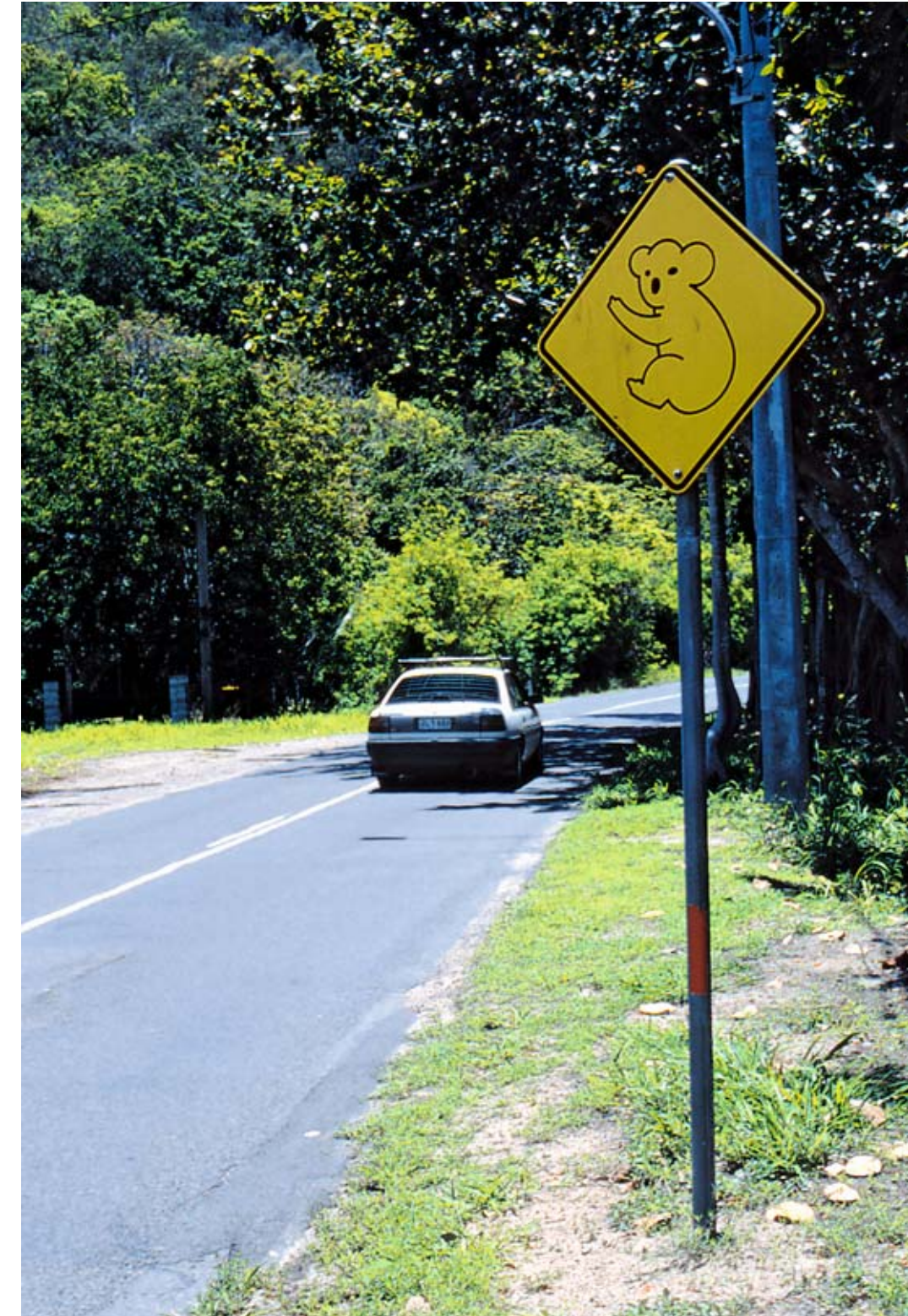
Na ostrově jsou rozsáhlé mangrovňové porosty a také zde žije známé a typické australské zvíře, Koala medvídkovitý. Přestože připomíná vzhledem malého medvěda, ve skutečnosti se však jedná o vačnatce (mláďata se vyvíjejí ve vaku matky, podobně jako např. u klokana), který obvykle váží 4–12 kg a měří zhruba tři čtvrtě metru. Vyskytuje se jen na východním pobřeží Austrálie, protože je potravním specialistou – živí se jen listím a kůrou blahovičníků (eukalyptů).

Koalové byli v minulosti téměř vyhubeni člověkem kvůli kožešině. Spí až 20 hodin denně a krmí se většinou v noci. Proto je extrémně těžké je spatřit a vyfotografovat. Nicméně zde, na ostrově, jsou řidiči varováni, aby byli obezřetní, protože projíždějí lesem, kde se koala vyskytuje.